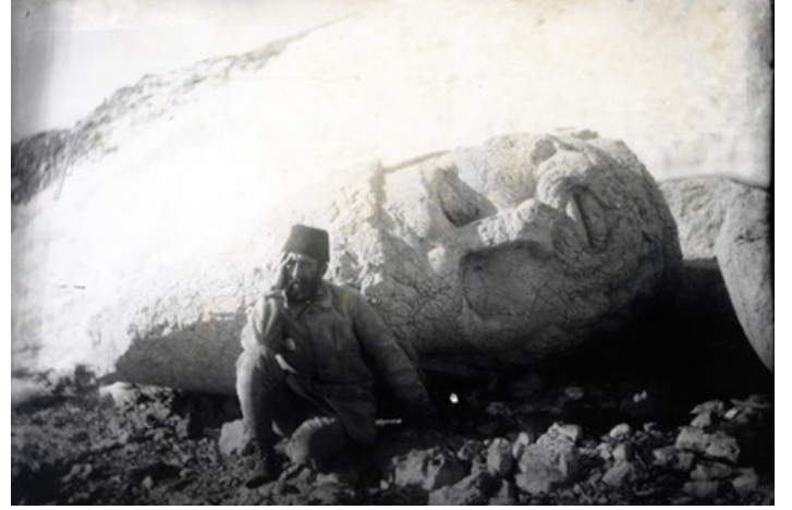
Osman Hamdi Bey Nemrut’ta, 1899