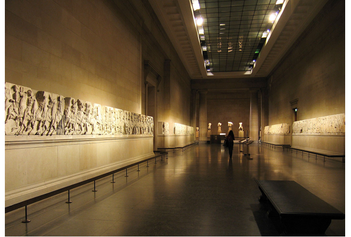
Londra'da bulunan British Museum'daki Elgin Mermerleri

Öğrencilerin Geçmişe Hücum sergisinin temalarını keşfetmesi için bir başlangıç noktası olarak, bu dönemdeki eski eser yarışı ile eserlerin bir alandan diğerine taşınması üzerine bir tartışma geliştirmenizi öneririz. Bir nesnenin asıl bağlamından koparılması ne anlama gelmektedir ve bu uygulamada arkeolojinin oynadığı rol nedir?