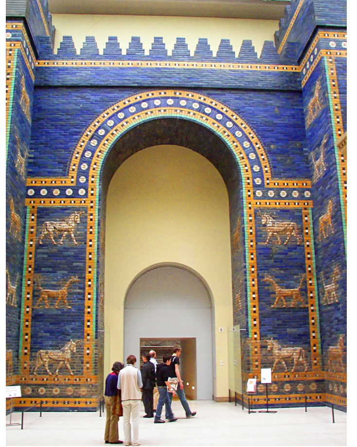
İştâr Kapısı, Pergamon Museum, Berlin

Daha önceki etkinliklerin bir devamı olarak, öğrencilerinizin Babil'deki İştâr Kapısı'nın çeşitli şekillerde canlandırımını bağımsız olarak araştırmalarına fırsat verin. Mümkünse, kapının koleksiyonlarındaki parçalarını görmek -ve eski eserlerin taşınması, sahiplenilmesi ve geçmişin yeniden değerlendirilmesi hakkındaki