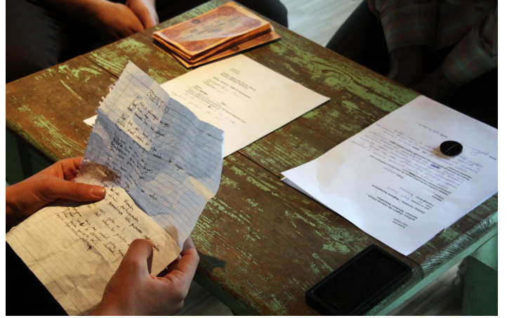
3 Kasım 2011'de Avusturya Lisesi öğrencilerinin katılımıyla gerçekleştirilen Değeri ne olursa olsun... atölyesi.