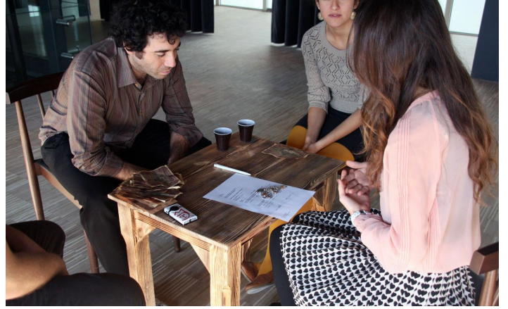
4 Kasım 2011'de Beyoğlu İTO Kız Teknik ve Meslek Lisesi öğrencilerinin katılımıyla gerçekleştirilen Değeri ne olursa olsun... atölyesi.

Sınıf olarak, SALT Galata'daki Geçmişe Hücum sergisini ziyaret edin. Öğrenciler, Michael Rakowitz'in hazırladığı enstalasyona bir gönderme yapacak şekilde, tarihsel olarak "değerli" olduğunu düşündükleri nesnelere bir araya getirecekler.