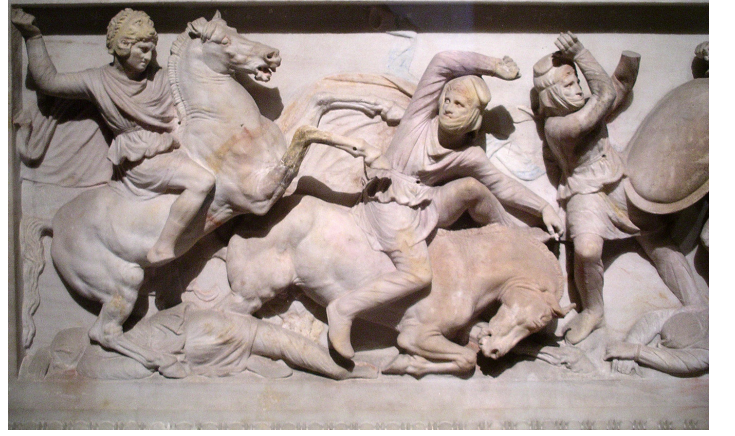
İstanbul Arkeoloji Müzesi'ndeki İskender Lahti'nden detay