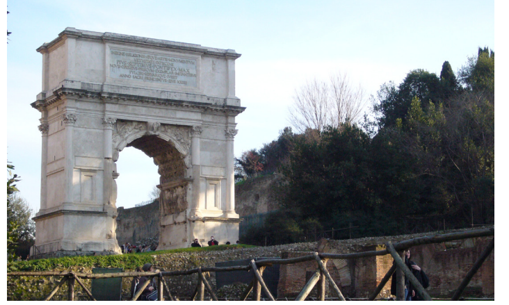
Titus Kemerı, Roma (MS 81)