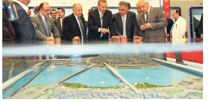
Başbakan Recep Tayyip Erdoğan, Taksim metro hattını Haliç üzerinden Marmaray projesine bağlaması planlanan bir köprü modelini inceliyor ( Zaman , 8 Mayıs 2011).

UNESCO (Birleşmiş Milletler Eğitim, Bilim ve Kültür Örgütü) — Birleşmiş Milletler'in (BM) özelleşmiş bir dairesi. Amacı “adalet, hukukun egemenliği ve insan haklarının yanı sıra BM Antlaşması'nda beyan edilen temel özgürlüklere ilişkin evrensel saygıyı artırmak üzere eğitim, bilim ve kültürde uluslararası işbirliğini desteklemek aracılığıyla barışa ve güvenliğe katkıda bulunmak” olarak ifade edilmiştir. Milletler Cemiyeti'nin Milletlerarası Fikri İşbirliği Komitesi'nin varisidir.