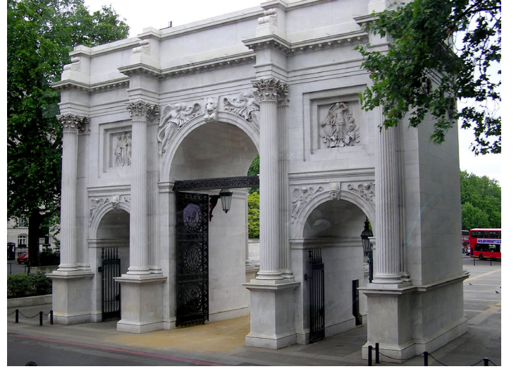
Mermer Kemer, Londra (1828)