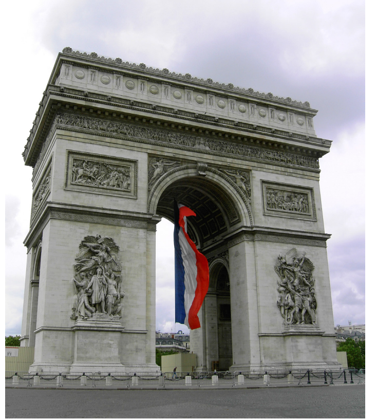
Zafer Takı, Paris, Fransa (1806-1836)