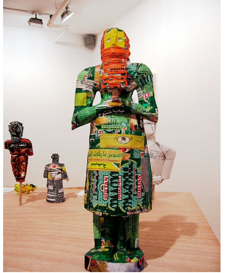
Michael Rakowitz, The invisible enemy should not exist [Görünmez düşman var olmamalı], 2007

Geçmiş sahiplenme arzusu, birtakım olumsuz sonuçları da beraberinde getirmiştir. Örneğin; Osmanlı İmparatorluğu'nda Avrupalıların yürüttüğü arkeolojik kazılar, eski eserlerin bölge halkı tarafından çalınmaktan ya da yok edilmekten "kurtarılması" amacıyla gerçekleştirilmekteydi. Fakat çoğu zaman bu eserler, arkeologlarca izinsiz olarak yurtdışına çıkarılıyor, yani "yağmalanıyordu". Günümüzde hâlen yağmacılık olaylarına rastlamak mümkün. Mesela, ABD'nin 2003'te Irak'ı işgali sırasında, ülkenin ulusal müzesinden binlerce eser çalındı ve pek çok arkeolojik alan talan edildi. Söz konusu dönemde, yüz binlerce kıymetli nesnenin yağmalandığı tahmin ediliyor.