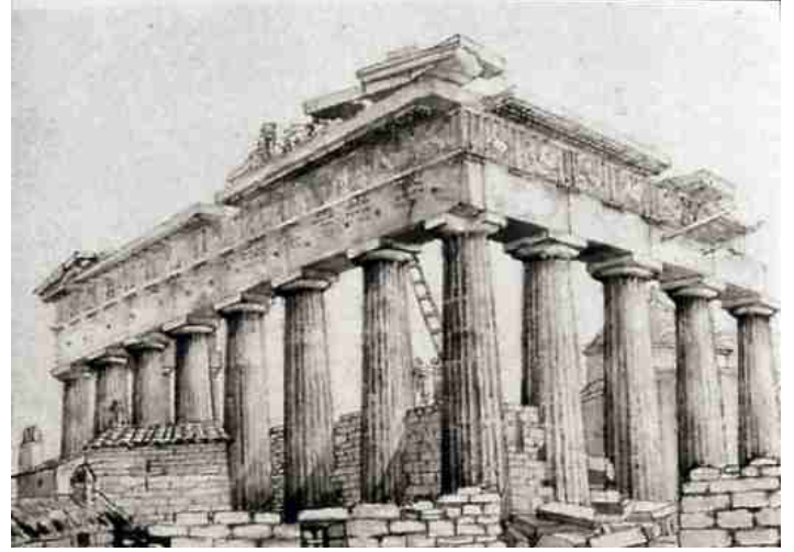
Parthenon (Akropolis, Atina), takriben 1802. Sanatçı Giovanni Battista Lusieri, bazı mermerleri almak üzere Parthenon'a tırmanmış.

Osmanlı İmparatorluğu, kendi topraklarında kazı yapılmasına ve bulunan eski eserlerin yurtdışına çıkarılmasına ilişkin başta hoşgörülü bir yaklaşıma sahipti. Ancak eski eserlerin siyasi ve ekonomik önemi belirginleştikçe, imparatorluk, sahip olduğu tarihi alanları korumada giderek daha etkin hale geldi. 1869'dan sonra eski eserlerin yurtdışına çıkarılmasını yasaklayan çok sayıda yasa yürürlüğe girdi. 1891 yılında ise Osman Hamdi Bey'in girişimiyle, Osmanlı İmparatorluğu'nun arkeolojiye dair iddiasını ortaya koymak ve kazılardan çıkarılan eserleri barındırmak üzere Müze-i Hümayun (bugünkü adıyla İstanbul Arkeoloji Müzeleri) kuruldu.