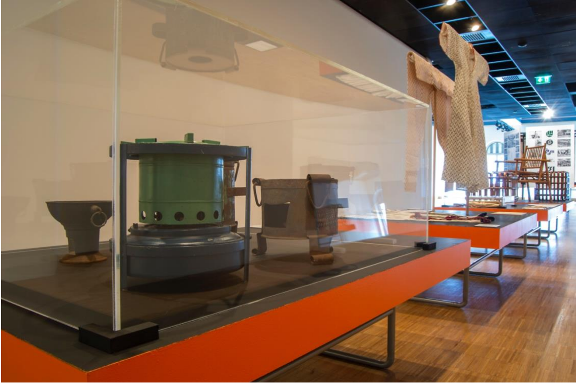
bauhaus imaginista: Uzaklarda. İstanbul sergisinden genel görünüm, SALT Beyoğlu, Ocak 2020