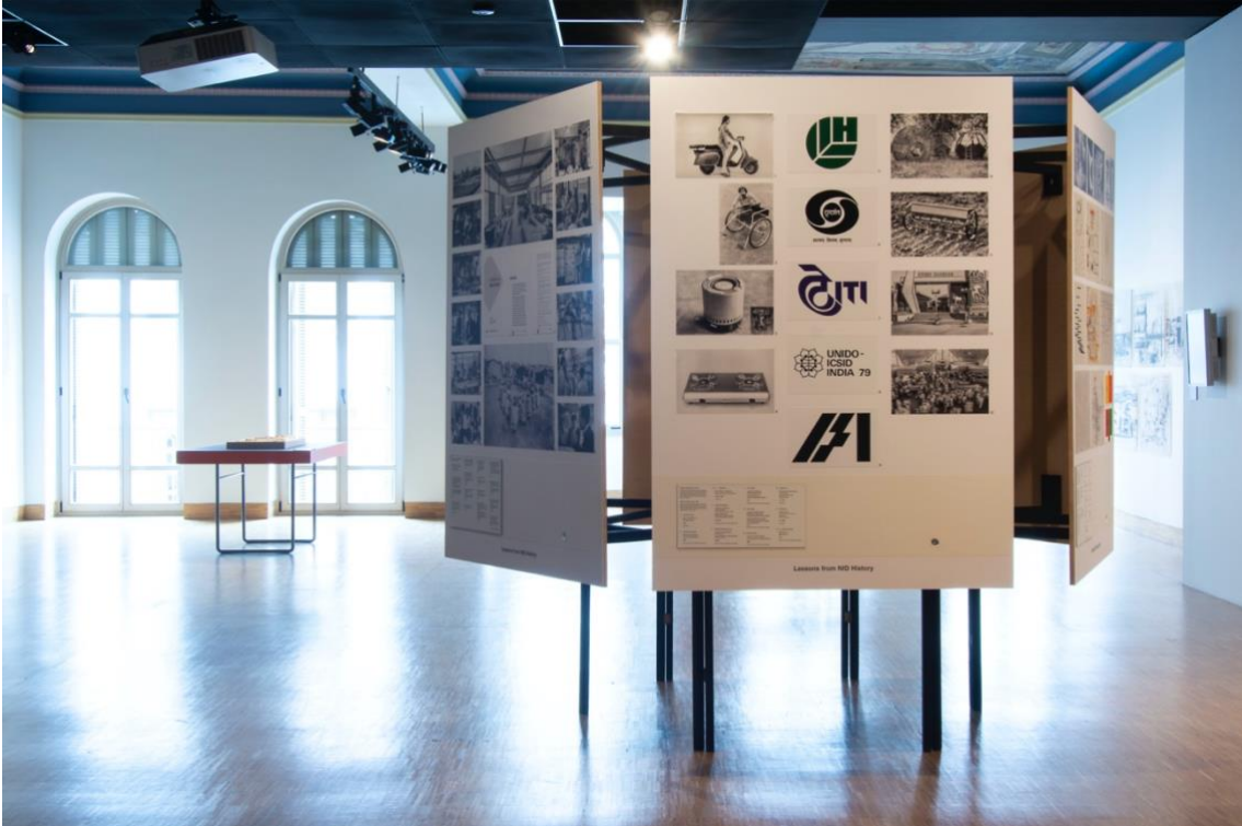
bauhaus imaginista: Uzaklarda. İstanbul sergisinden genel görünüm, SALT Beyoğlu, Ocak 2020