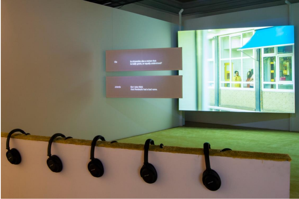
Wendelien van Oldenborgh, Two Stones [İki Taş] enstalasyonundan detay, 2019 bauhaus imaginista: Uzaklarda. İstanbul , SALT Beyoğlu